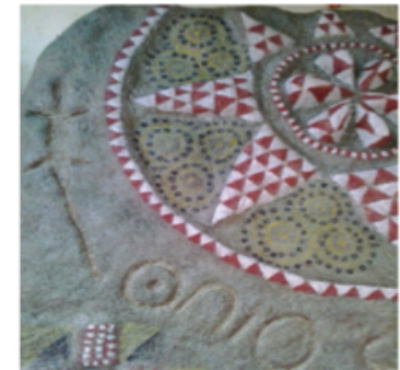
TOMÁS DORESTE CABALLERO