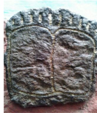
TOMÁS DORESTE CABALLERO